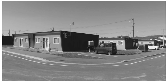
町内で一番新しい公営住宅（栄町）

は連帯保証人が2人必要で、未納家賃の支払いや死亡時の手続き等が保証人の責務となっています。