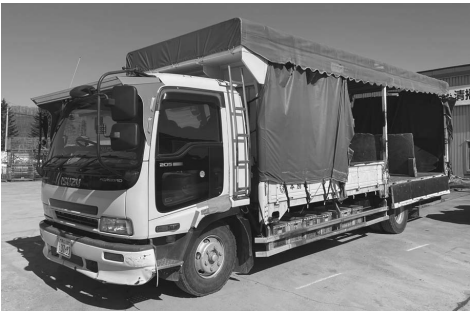
修理したごみ収集車

答 同等の中古車両購入も検討しましたが、修繕の倍以上の金額が掛かり、購入後すぐに壊れたということにはなりません。