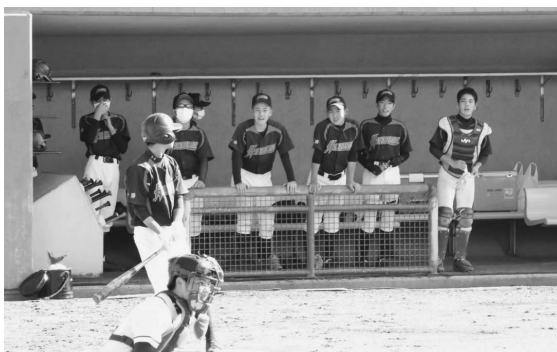
全道大会で活躍する子どもたち

その他の各種文化・スポーツ大会は、全道・全国ともに8割補助となっています。 ①過去に自己負担が理由で不参加の児童・生徒はいましたか。 ②本別町はスポーツ推進宣言の町であり、児童・生徒の全道・全国大会出場には全額補助すべきと思いますが考えを伺います。