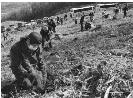
多くの町民が参加 植樹祭

答 町民植樹祭や林業専用道開設、民有林造林促進事業に関わる経費に充当しています。