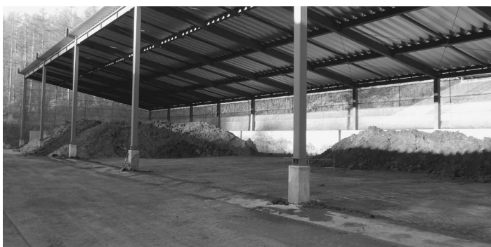
汚泥のストックヤード