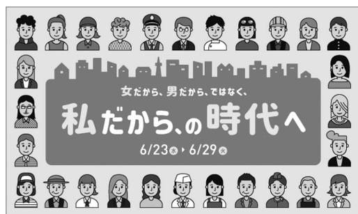
国の男女共同参画週間ポスター(令和3年)

②農協、若手農家とも十分意見交換、協議をしながら進め、脱水汚泥のストックヤード建設も検討していきます。