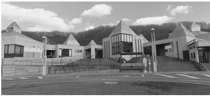
暑さ対策で夏も快適 道の駅

答 映像データの取り扱いについて要綱等を定め、適切に管理を行い、車内へ録画中の旨の掲示や利用する児童生徒、保護者などへ周知を行っていきたいと考えます。