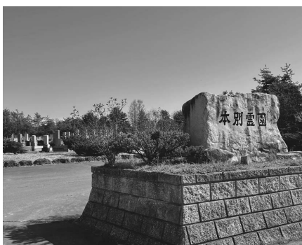
合同納骨塚のニーズは？

また、人口減の中、合同納骨塚を設置することによって、本町を離れた方と何らかのつながりを維持することについて、見解を伺います。