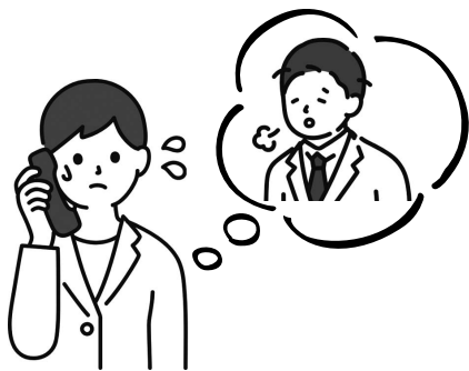
一人で悩まず まずは相談

町民へ取り組みがなかなか浸透していない部分もあると思いますので、啓発、周知を行う必要があると考えます。