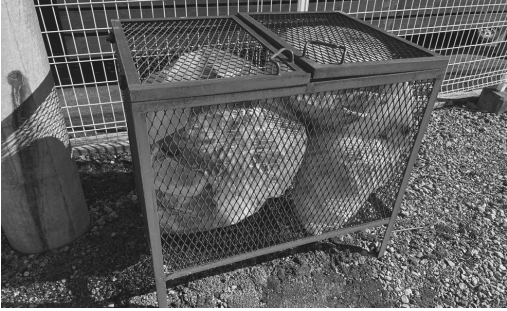
自治会で管理するごみ箱

31年度より帯広市の十勝圏複合事務組合「くりりんセンター」に搬入しています。組合では施設の更新を予定しており、令和9年度の供用開始を目指し計画を進めています。町として多額の負担となることから、しっかりとした議論が必要であると考えます。