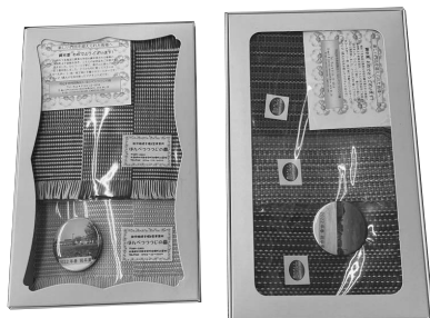
メッセージを添えた記念品

答 町内の障害者支援施設より手作りのランチョンマットを記念品として贈呈しています。