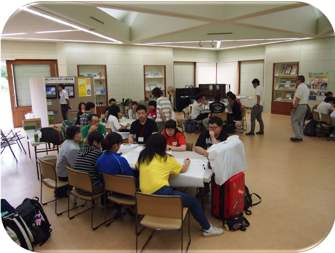
ミーティングカフェ