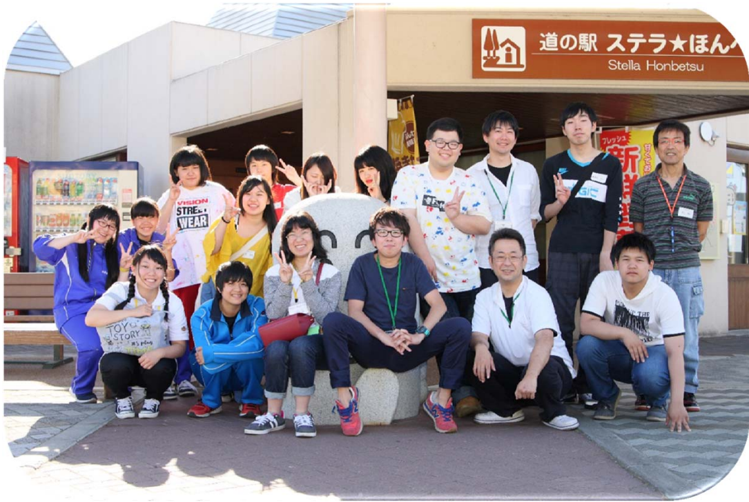
参加者全員で記念撮影