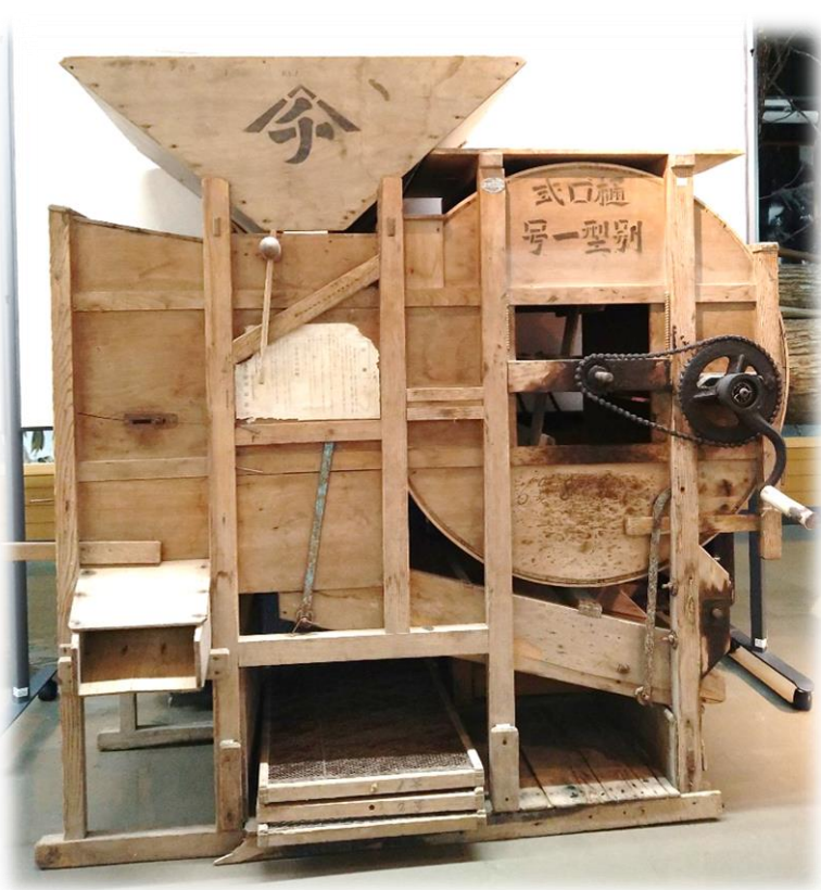
本別町で製作された樋口式唐箕(とうみ)

1945年7月14日・15日の両日 北海道はアメリカ海軍機の攻撃を受けました この空襲で本別は十勝で最大の被害 根室は函館、室蘭に次ぐ大きな被害となり 人々の命と暮らしが失われました けれども残された資料や記録は 78年前のまちの姿を現在に伝えてくれます