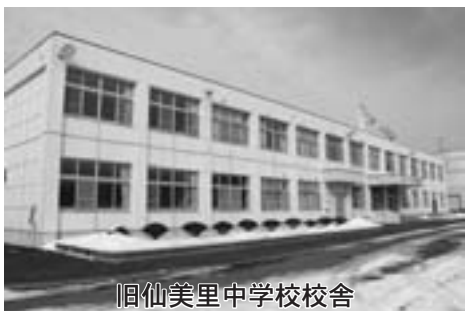
旧仙美里中学校校舎

町では、平成26年3月に閉校となった旧仙美里中学校の施設を利用する事業者等を次の通り募集します。