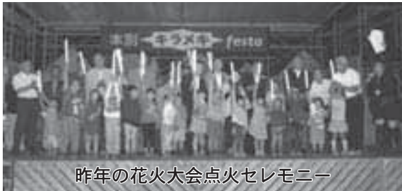
昨年の花火大会点火セレモニー