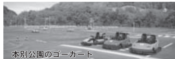
本別公園のゴーカート