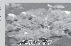
フロストフラワー

オンネットーは冬も魅力がいっぱいなことをご存じですか？凍った湖面に現れる、近年話題のアイスハッブルやフロストフラワーはもちろん、澄んだ空気の中で見る阿寒の山々は絶景です。スノーシューで歩く湖畔までの散策路も、動物の足跡や凍った樹木など、冬ならではの景色の中を散策することができます。