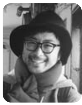
きくちちきさん(右)と イラストメッセージ