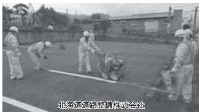
北海道道路整備株式会社