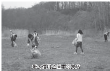
帯広信用金庫本別支店