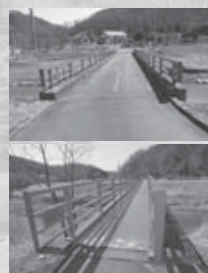
はごろもばしともみじばし もベンキを塗って衣替え