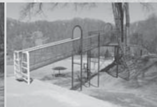
アスレチック広場に更新されたツリーデッキ(右)と ザイルクライミング、ザイルネット(左)の3基の遊具