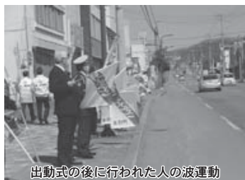
出動式の後に行われた人の波運動

令和2年の全国交通事故死者数は4年連続で戦後最少を更新したものの、2839人が犠牲となっており、そのうち、道内での交通事故死者数は144人で全国のなかで3番目と相変わらず上位に君臨しています。 交通事故は、ちょっとした油断から取り返しのつかない事態を引き起こし、多くの人たちに心の傷痕をのこします。 悲惨な交通事故をなくすため、家庭のなかで交通ルールや交通マナーを今一度確認し、あい、次代を担う子どもやお年寄りなど尊い命を守るため、家庭から交通安全に取り組みんでいきたいと思います。