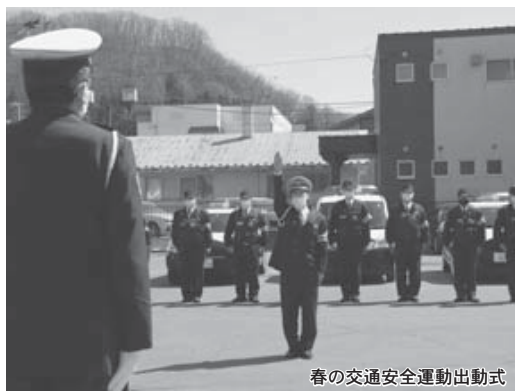
春の交通安全運動出動式

気温が上昇するにつれ、気持ちも緩みがちになり、ついスピードを上げてしまうこの季節。悲惨な交通事故に遭わないため、春の交通安全運動（4月6日から15日）の出動式が4月6日、本別警察署で行われました。この出動式を皮切りに、学校などで交通安全の取り組みが行われました。