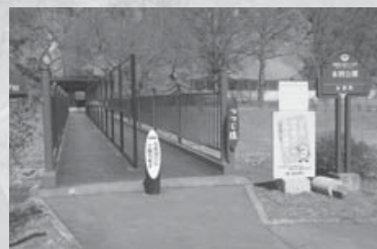
鉄製の欄干への変更や飛沫防止 パネルが設置されたつつじ橋