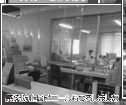
感染防止にビニールもつるしました