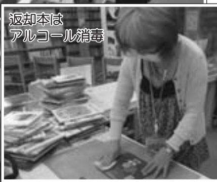
返却本は アルコール消毒