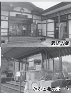
かぶと池のボート