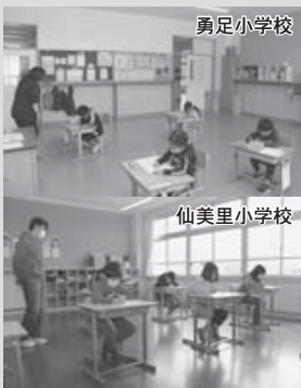
分散登校でお互いの距離をとって授業を実施