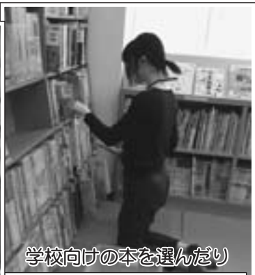
学校向けの本を選んだり