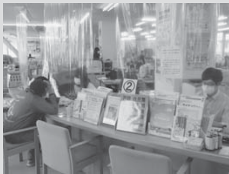
役場窓口等に飛沫感染防止のため、ビニールカーテンを設置

町では、全国的な新型コロナウイルス感染症のまん延を受け、本町での感染を防止するため、多くの人が集まる行事等の中止や町施設の休館、人から人への飛沫感染防止策など、さまざまな対策を行っています。 町民の皆さんには、ご不便をお掛けしますが、ご理解ご協力をお願いします。