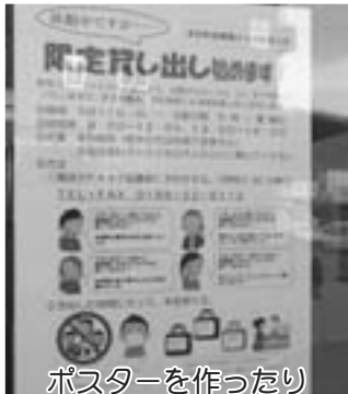
ポスターを作ったり