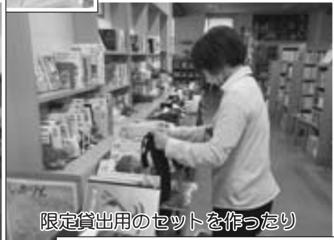
限定貸出用のセットを作ったり