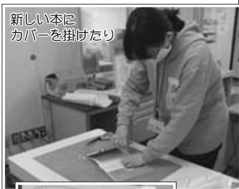
新しい本に カバーを掛けたり

新型コロナウイルス感染症の影響により、5月31日まで休館となりました。元どおりに出歩ける生活が待ち遠しいですね。図書館もカフェや読み聞かせを含めた通常開館が恋しいです。けれど、開館をただ待っていたわけではないのですよ！ということをお伝えするため、今回は休館中の仕事の一部をご紹介します。