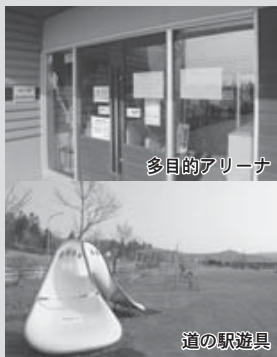
休館中の施設や休止中の遊具