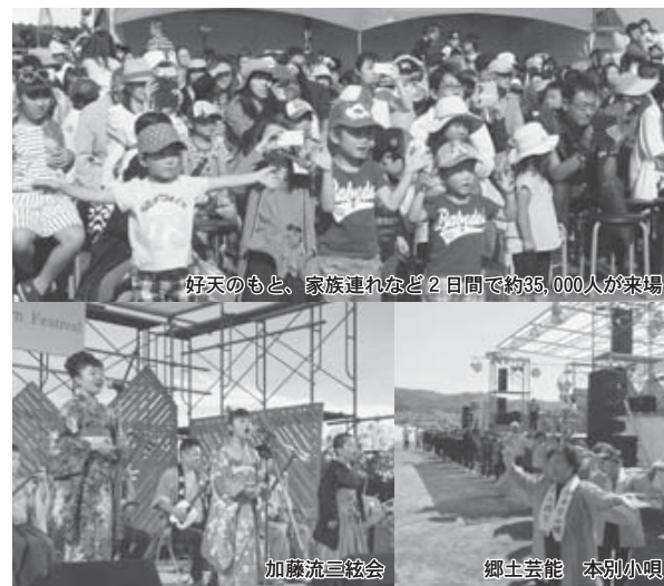
好天のもと、家族連れなど2日間で約35,000人が来場

来場者約3万5000人が 初秋のほんべつを満喫 今年で21回目を迎えた、本別最大のイベント「本別きらめきタウンフェスティバル2017（実行委員会主催）」が9月2日、3日の2日間、利別川河川敷地特設会場で開催されました。