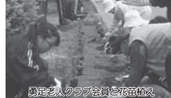
勇足老人クラブ会員と花苗植え