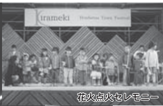
花火点火セレモニー