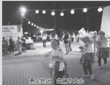
勇足地区 盆踊り大会