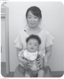
山手町 田 稜 (燕代)

本別町の未来を担うかわいい星たちです。 お父さん、お母さんのたくさんの愛に囲まれてぐっすり元気に育つこね！