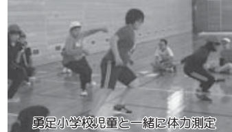
勇足小学校児童と一緒に体力測定