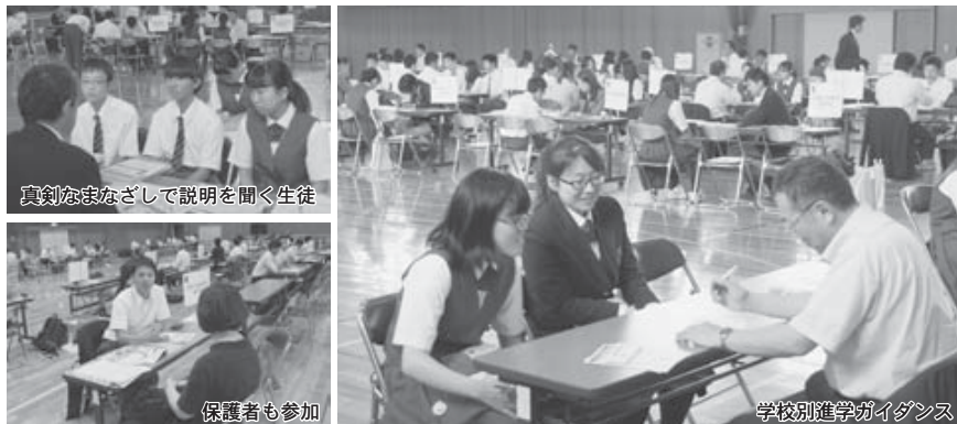
真剣なまなざしで説明を聞く生徒

午後からは、学校別の進学ガイダンスが同校体育館で行われ、参加した大学・短期大学や専門学校など72校2官公庁の担当者が、それぞれのブースで各校の取り組みや特色を資料など配布しながら説明。生徒や保護者らは興味のあるブースを訪れ、質問をするなどして積極的に情報を収集しました。同校生徒からは、「実際に担当者と話ことができ、目標が具体化された」などの声が聞かれました。また、夕方には進学マネー講座が行われ、保護者らは大学などの進学に掛かる具体的な費用や奨学金制度などについて理解を深めました。