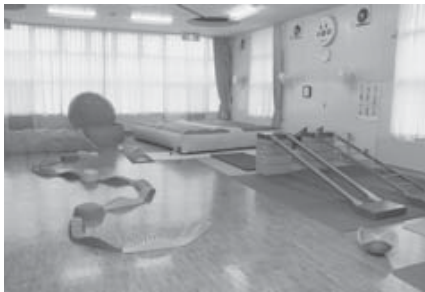
運動機能の発達を促すプレイルーム