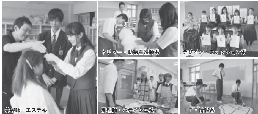
美容師・エステ系