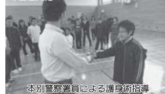
本別警察署員による護身術指導