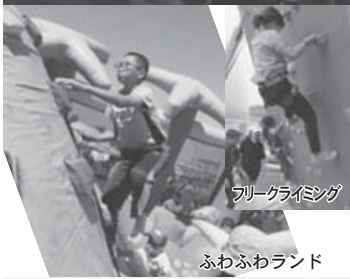
フリークライミング