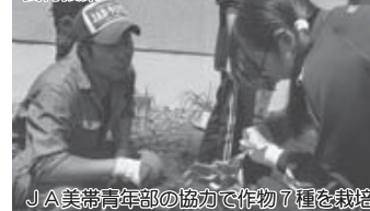
JA美帯青年部の協力で作物7種を栽培