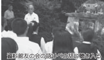
資料館友の会の語りべの話に聴き入る