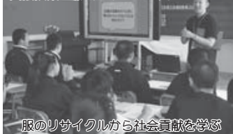
服のリサイクルから社会貢献を学ぶ