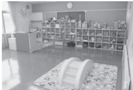
遊びながらコミュニケーション力を養うキッズルーム