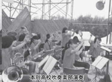
本別高校吹奏楽部演奏