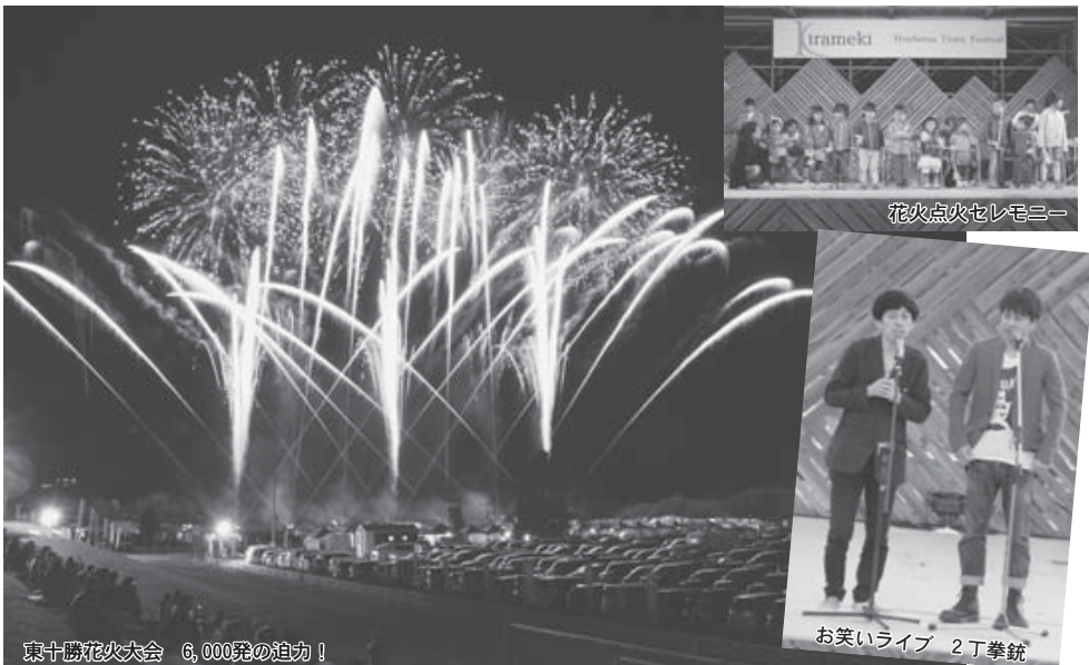
東十勝花火大会 6,000発の迫力!