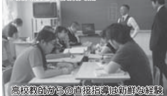
高校教師からの直接指導は新鮮な経験