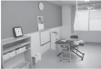
集中できる環境を整えた療育室