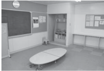
安心して利用できる相談室