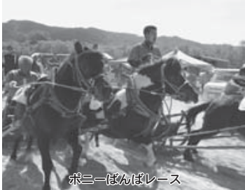
ボニーばんぼレース