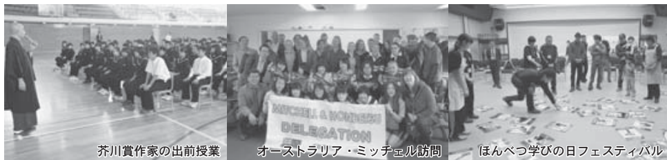
芥川賞作家の出勤授業