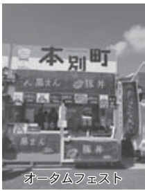
オータムフェスト

本別町観光協会や町内の団体等が道内のイベントに出店し、本別町の味覚をPRしました。札幌オータムフェスト2017第1期（札幌大通公園、9月8日～12日）ではキレイマメ味噌を使用した豚丼と豚まん、カミングパラダイス（白糠町、9月9日・10日）ではスイートコーンなどの野菜や豆加工品などを販売。本別町の出店ブースは大変にぎわいました。