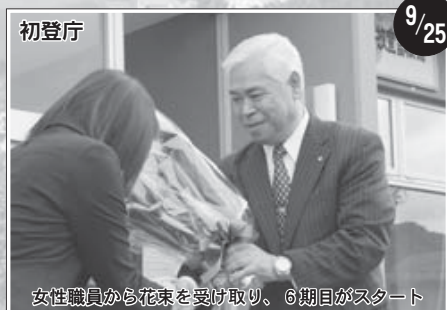
初登庁 9/25 女性職員から花束を受け取り、6期目がスタート

このたびの町長選挙におきまして、町民の皆さまの信任をいただき引き続き6期目の町政を担うことになりました。 最初、元職員が地方税法違反、加重取崩および業務上横領の容疑で逮捕されましたことにつきまして、誠に遺憾であるとともに、改めて町民の皆さまに深くお詫び申し上げる次第であります。今後二度と起こさないよう、職員一丸となって信頼回復に努めてまいります。 本町を取り巻く環境は一段と厳しさを増しておりますが、本町の舵取り役として、責任の重大さを痛感するとともに、皆さまの負託に応え、町民の一層の幸せと、町政発展のために私の力の及ぶ限り、全エネルギーを傾注してその任にあたる決意であります。 私は就任以来、一貫して町民と歩んできた協働のまちづくりを基本理念に、将来を担う子供たちの健全な成長および教育の充実と、暮らしの安全・安心を守る健康福祉、介護、医療、防災など町民生活を原点にサービスマインドの整備を全力で推進してまいりました。この間、度重なる災害や町をゆるがす大きな出来事に直面しましたが、町民皆さまの「町を愛し」「まちを育てよう」との熱い思いと、その行動力によって幾多の試練を乗り越えることができました。 この素晴らしい「町民力」は、ほんべつのまちづくりの原動力であり、本別に暮らす誰もが人生を楽しみ、地域がそれぞれの個性を発揮し、いきいきと安心して暮らすことができ、自信と誇りをもって、笑顔で「任んで良かった、任んでみたい」と実感できるまちを、今後とも、全力で築いてまいります所存であります。 ここで、6期目のまちづくりのビジョンについて申し上げます。 私は、まちづくりの重点目標は「共生・協働の安心と活力と夢あふれるまちづくり」といたしました。「おもいやりのこころ」「学びあい」を大切に、「環境との調和」「あふれる活力」の創造を進め、街中には「安心」と「活力」と「笑顔」、そして、子どもに「夢」と「希望」がいっぱいあふれるほんべつの創造をめざします。