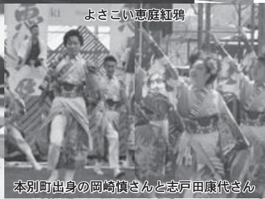
よさこい恵庭紅鴉