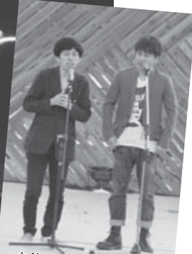
お笑いライブ 2丁拳銃