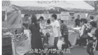
カミングパラダイス