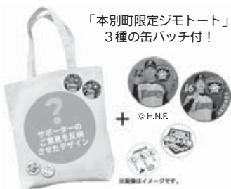
「本別町限定ジモトート」3種の缶バッジ付!

このプロジェクトは、応援大使に選ばれた市町村を対象に、それぞれの特徴をデザインした地元のオリジナルトートバッグ「ジモトート」を製作するものです。この企画に賛同される皆さんから1口2,000円で合計100口以上の協賛が集まれば、本別町オリジナルトートバッグが製作され、支援者には応援大使の缶バッジを付けたジモトートが送られます。皆さんの応援をお待ちしています。詳しくは町のホームページをご覧ください。 町ホームページ https://www.town.honbetsu.hokkaido.jp 問い合わせ 本別町役場企画振興課企画・生涯学習担当