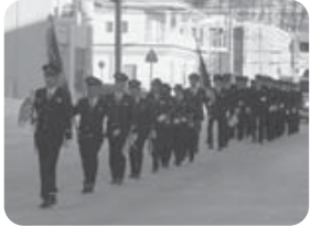
出初式での勇猛果敢な分列行進