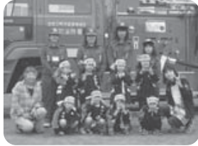
子供たちと楽しく防火PR「♪火の用心」