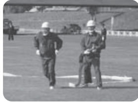
災害に対し、日々のためまぬ訓練