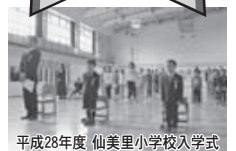
平成28年度 仙美里小学校入学式