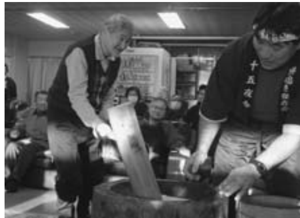
入所者ともちつきをする 本別もちつき保存会十五夜会の皆さん