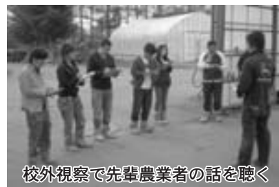
校外視察で先輩農業者の話を聴く