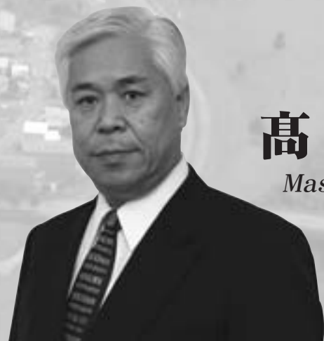
高橋 正夫 町長 Masao Takahashi