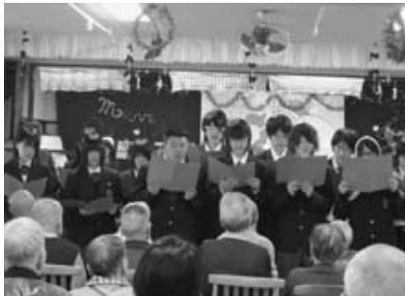
クリスマスソングを歌う高校生