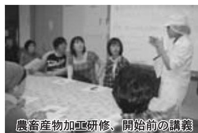
農畜産物加工研修、開始前の講義