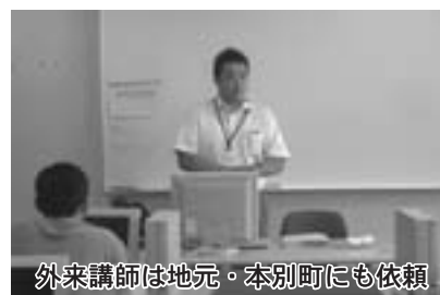
外来講師は地元・本別町にも依頼