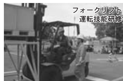
フォークリフト 運転技能研修