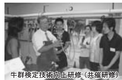
牛群検定技術向上研修（共催研修）