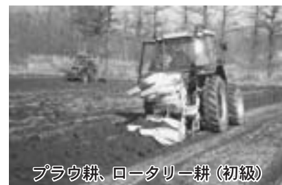
プラウ耕、ロータリー耕（初級）

農業機械を安全かつ効率良く利用する知識や、技術を身につけるため、「農業機械高度利用研修（初級・中級・上級・リーダー養成）」を行っています。その他、農業土木機械・フォークリフト・溶接などのように、資格を取得できるものや、搾乳システムの基礎を学ぶ研修もあります。