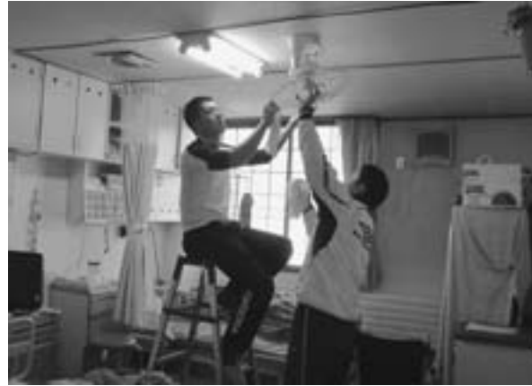
ホームの中をきれいにする自衛隊の皆さん