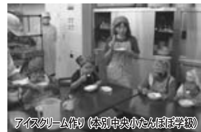
アイスクリーム作り（本別中央小たんぽぽ学級）