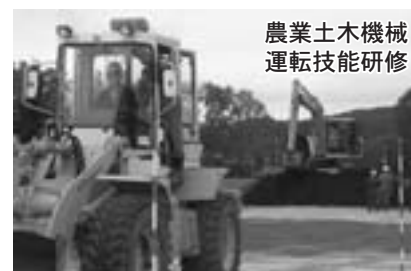
農業土木機械 運転技能研修