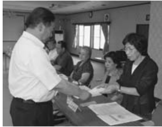
委嘱状を受け取る新委員