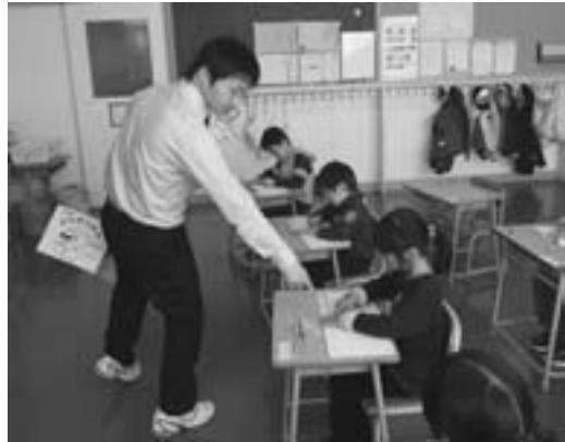
勉強をがんばる2年生