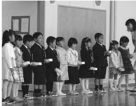
11人の新1年生が入学しました