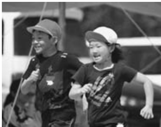
全力で走った勇足大運動会