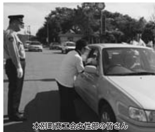
本別町商工会女性部の皆さん