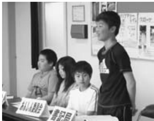
児童会は高学年が引っぱります