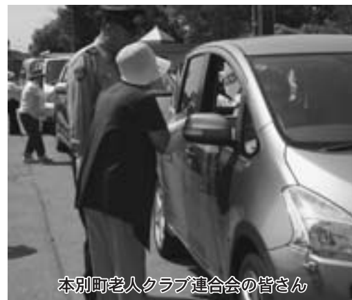
本別町老人クラブ連合会の皆さん