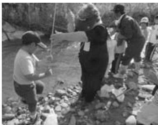
ゆうゆうサークルの様子 地域の子育て支援に感謝しています