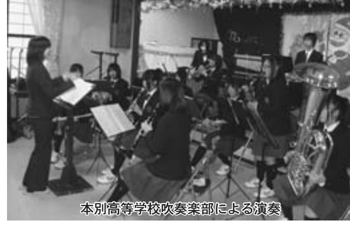
本別高等学校吹奏楽部による演奏