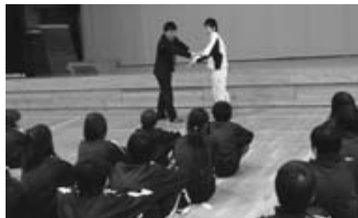
後期避難訓練で、不審者対応について本別警察署員から実技の講習を受けました