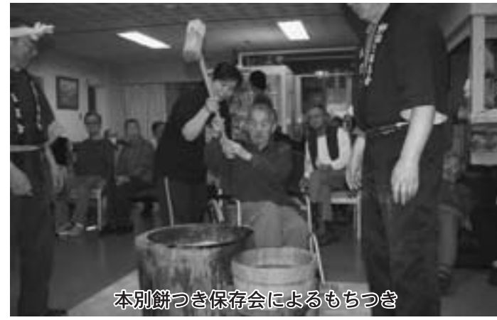
本別餅つき保存会によるもちつき