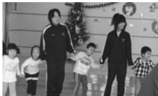
選択音楽のミュージカル発表の一コマ。保育所のお子さんたちと素敵なクリスマスのひとときとなりました

地域のみなさんに支援を受けながら生徒・教職員一体となって学びを進めています (後期の学校の様子から)