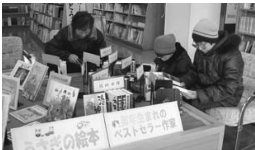
展示コーナーで本を読む来館者

これから、さまざまな本を工夫しながら紹介していきますので、どうぞご利用ください。