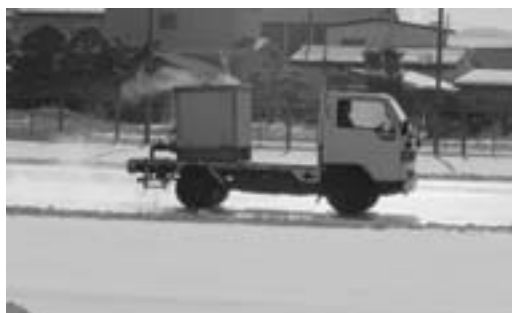
体育の授業で長靴アイスホッケーに使用するリンクの造成。厳冬の作業に公務補さん中心に取り組んでいます