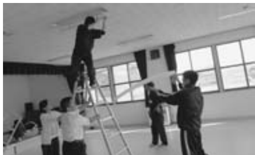
地域ボランティアの一環として、今年度は仙美里地区公民館の清掃に取り組みました