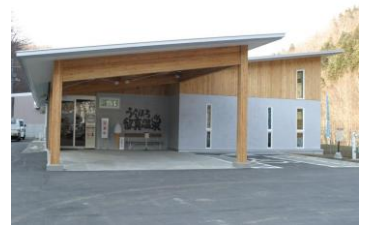
うらほろ留真温泉