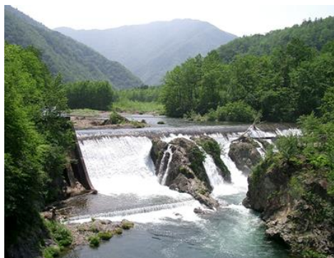
ピョウタンの滝(札内川園地)

札内川の語源であるアイヌ語で「乾いた川」を意味する「サチナイ」と、その中流に位置するという意味。