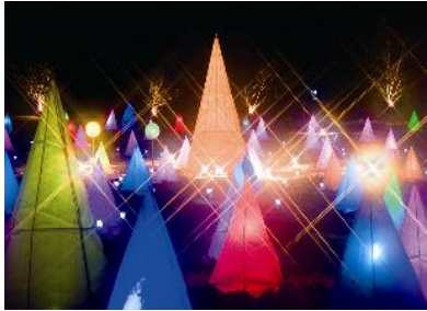
十勝川白鳥まつり 彩凜華 (1月下旬～2月下旬頃)

アイヌ語の「オトプケ」（毛髪が生ずるという意）から転訛したもので、音更川、然別川など河川がたくさん流れているところから付けられたと言われている。