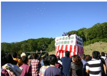
ふるさとのみり祭り

アイヌ語の「オーラポロ」が転訛して浦幌となり、「オー」は川尻、「ラ」は草の葉、「ポロ」は大きいで「川尻に大きな葉が生育するところ」といわれている。