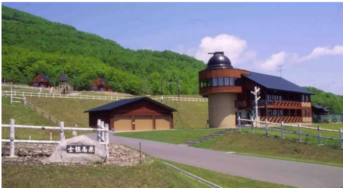
士幌高原ヌブカの里

“広大な土地”を意味するアイヌ語の「シュウウォロー」が訛って変化して名付けられたといわれている。