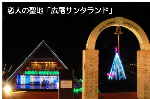
恋人の聖地「広尾サンタランド」