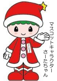
マスコットキャラクター さーたちちゃん