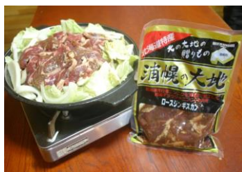
ギョウジャンニク入りジンギスカン

十勝管内の最東端に位置し、町土の約74.2%を森林が占める雄大な自然と、海産資源豊富な太平洋に面した町です。