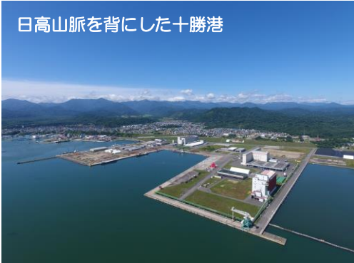
日高山脈を背にした十勝港

アイヌ語の「ピルイ」が語源といわれ、「ピ」は「石が転がる」、「ルイ」は「砥石がとれる地」という意味。