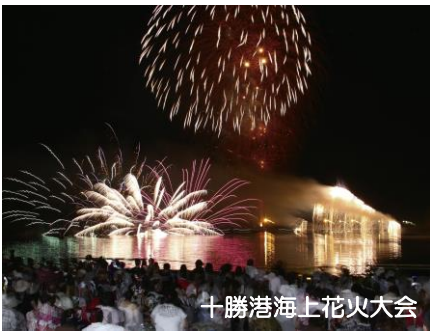
十勝港海上花火大会