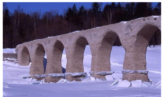
タウシュベツ川橋梁(冬)