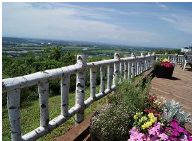
十勝が丘展望台シーニックカフェ (7月上旬～9月下旬頃)