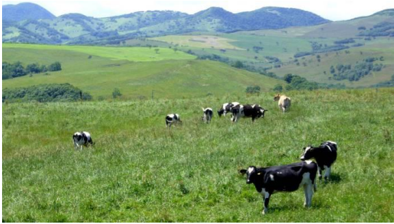
ナイタイ高原牧場

昭和6年士幌村より分村し、士幌村の川上に位置していたため、「上士幌村」となった。