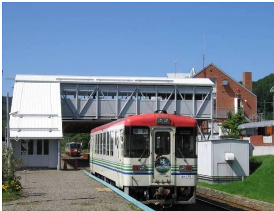
ふるさと銀河線りくべつ鉄道

アイヌ語で「鹿のいる川」または「危ない高い川」という意味の「リクンベツ」に由来しているといわれている。