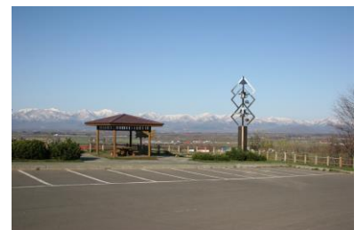
美蔓パノラマパーク