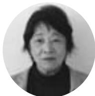
なか の ひでこ 中 野 秀 子 錦 町 錦 町