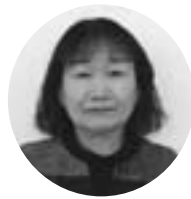
すぎ おか まさひろ 杉 岡 雅 江 北3丁目 北3丁目