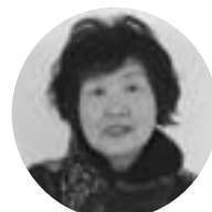
しろ いし みちこ 白 石 道 子 栄 町 栄 町