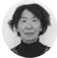
のぞみ みえこ 能 祖 美 恵 子 北6丁目 北6丁目・清 流 町