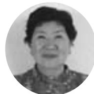
おお ば ひろこ 大 場 廣 子 柏 木 町 柏 木 町