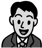
お 名 前 住 所 担 当 地 区