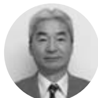
なか まえ こうじ 中 前 孝 二 向 陽 町 向 陽 町・老 人 ホ ー ム