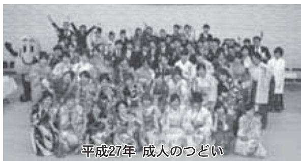
平成27年 成人のつどい