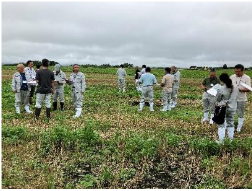
圃場にて農地の評価をしました

*1 目ならし・・・農業委員会では、4グループ持ち回りで、利用調整で必要となる農地の評価を行います。どのグループが行っても同じになる様に、全員で評価の仕方、考え方を統一します。